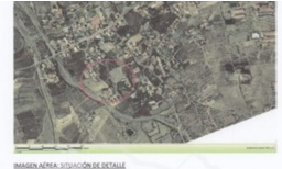
IMAGEN AEREA SITUACION DE DETALLE